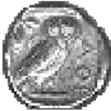
Une drachme, Athènes, V ème siècle B.C.